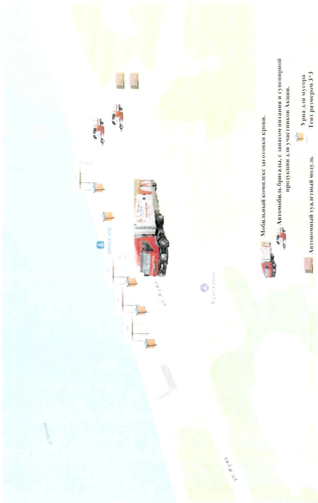
Схема дислокации Мобильного комплекса заготовки крови на площадке «Причал»